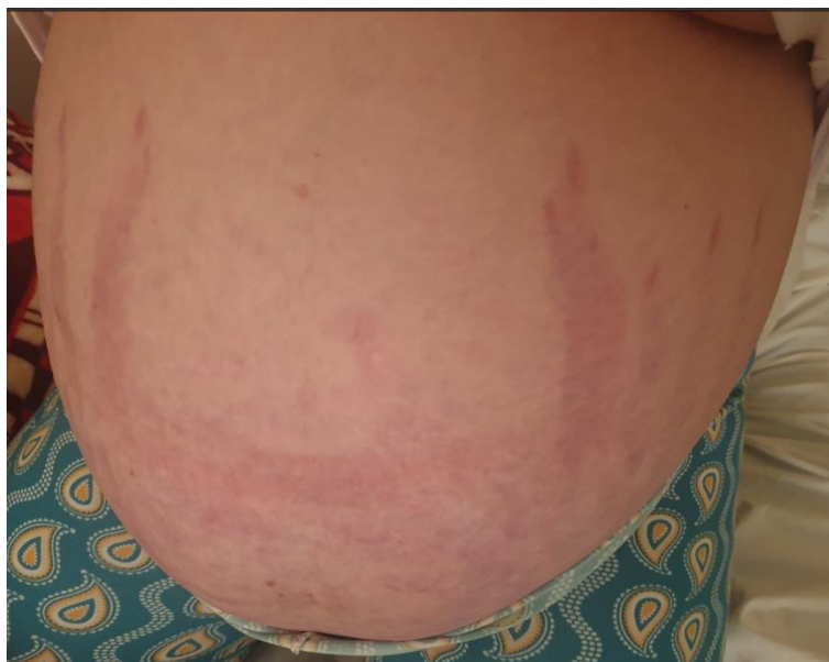
Figure 1 : vergetures pourpres au niveau de l'abdomen.

Devant l'association d'un diabète difficile à équilibré, d'une HTA et d'une obésité facio-tronculaire un syndrome de cushing fut évoqué. La biologie d'investigation montre un Cortisol Libre Urinaire sur 24h élevé à 405 ug/24h (2,3 X la normale), une perte du cycle nyctéméral du cortisol salivaire et plasmatique associés à une ACTH indétectable tout au long du cycle [Tableau 1].