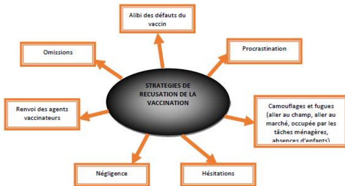
Figure n° 2 : Comportements de réticence face à la vaccination Source : Enquête de terrain, Octobre 2018

manifestes chez les parents comme illustrés par la représentation schématique ci-dessous.